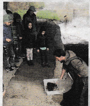
▲ Tvormi mesta sú aj živočíchy žijúce na dne Chorvátskeho r...