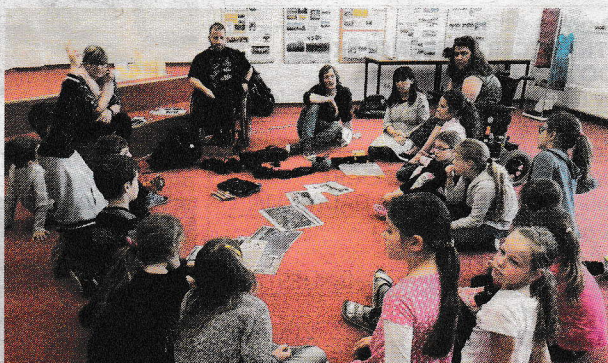
▲ Ako vnímajú verejný priestor vozíčkari?