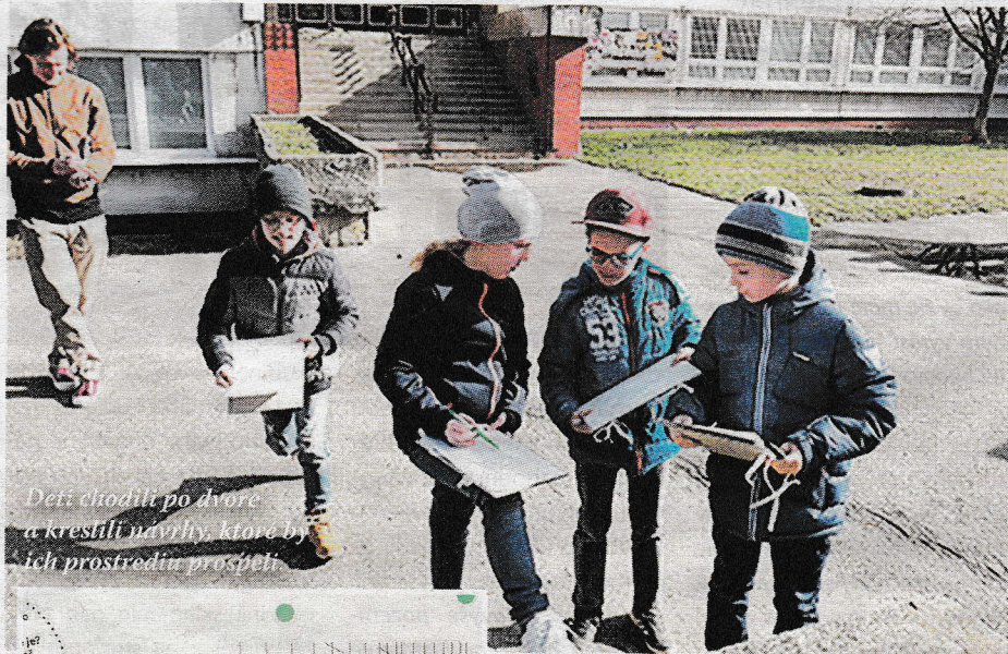
Deti chodili po dvore a kreslili návrhy, ktoré by ich prostredím prospeli