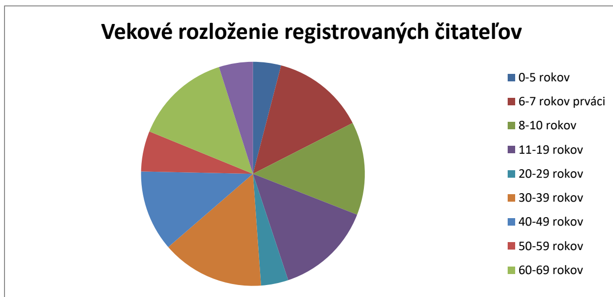
Graf: Vekové rozloženie registrovaných čitateľov

Zloženie registrovaných čitateľov a v našich pobočkách tvoria obyvatelia Petržalky, iných mestských častí Bratislavy a tiež z častí Slovenska. Sú to hlavne študenti vysokých škôl, žijúci na internátoch, či privátoch v našom meste a ľudia v produktívnom veku žijúci v podnájme, či prenajatých bytoch v Petržalke.