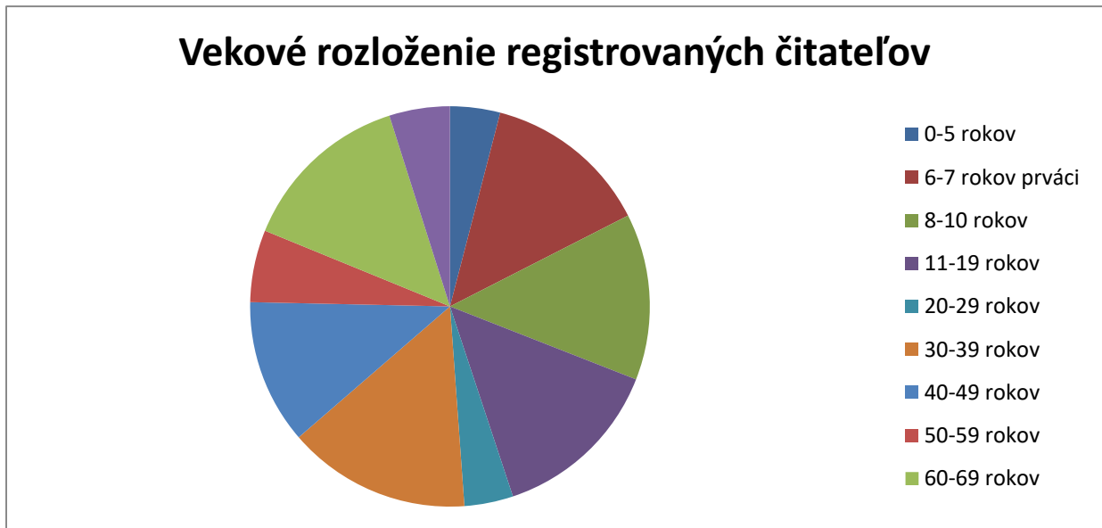
Graf: Vekové rozloženie registrovaných čitateľov

Zloženie registrovaných čitateľov knižnice tvoria obyvatelia Petržalky, iných mestských častí Bratislavy a tiež rôznych častí Slovenska. Sú to hlavne študenti vysokých škôl, žijúci na internátoch, či privátoch alebo osoby v produktívnom veku žijúce v podnájme, či prenajatých bytoch v Petržalke.