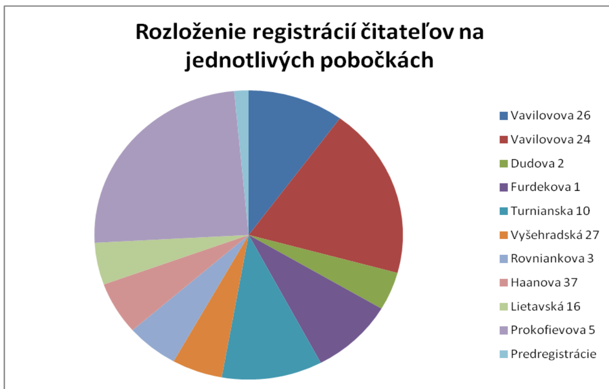
Graf: Pomer registrovaných čitateľov na jednotlivých pobočkách